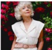
Plus 60 Beauty