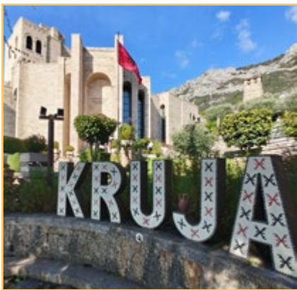
Festung in Kruja