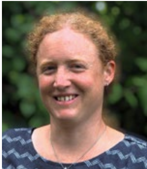
Silke Volz Büro