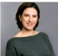
Ihr neues LinkedIn Foto